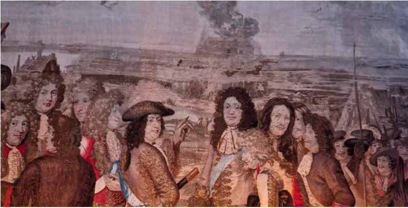
Kuva 2. Rosenborgin linnan pitkä- eli ritarisalin 1600-luvun lopulla valmistetuissa kuvakudoksissa kuvattiin Tanskan voittoisia taisteluita. Kuvakudokset täytettiin tunnetuilla ja tunnistettavilla herroilla, jotka kantoivat päässään peruukkia, aikakauden tunnusmerkkiä. Henkilökuvat muistuttavat peruukkien ajan taideteoksia, joissa peruukilla oli tärkeä roolinsa. Ani harvoin, jos koskaan, kuvaan pääsi peruukkien valmistaja.

yllellisyystuotteiden tuottajina. Ei ole sisäistetty sitä, että he edustivat samanaikaisesti käsityö- ja palveluteollisuutta tuottaen välttämättömyyttä ja että hiusalalla erikoistuttiin peruukintekijöiksi, kampaajiksi ja partureiksi eli hiustenleikkaajiksi. 18 Tuotteet, peruukit, tupeet ja hiuslisäkkeet, eivät sinällään olleet ylellisyyttä, mutta peruukintekijöiden ja kampaajien tuottamat palvelut olivat.